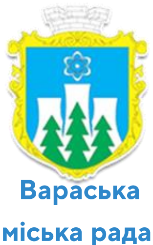
Вараська міська рада